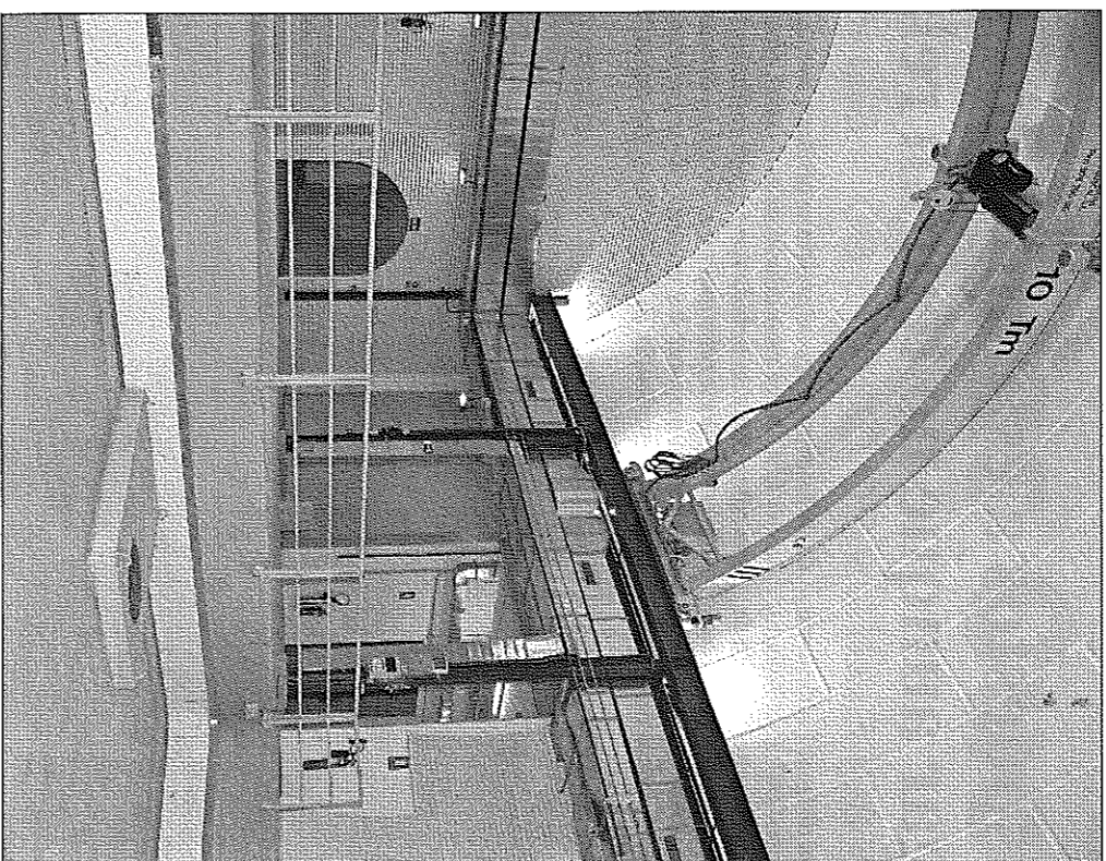
Sala central del Laboratorio Subterráneo de Canfranc tras las obras de refuerzo llevadas a cabo en estos tres últimos años

nacionales, es un experimento que comienza con la reapertura del Laboratorio de Canfranc. Su objetivo es detectar por primera vez un raro fenómeno que ocurre con los neutrinos, una partícula 'singular' en el ya extraño zoo de partículas fundamentales (no tiene carga eléctrica y su masa es muy reducida, por lo que interactúa de forma débil con el resto: de hecho, constantemente somos atraídos por neutrinos procedentes del Sol). Este fenómeno se conoce como 'desintegración doble beta sin neutrinos', y, de detectarse, confirmaría una suposición teórica: que el neutrino es su propia antipartícula.